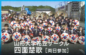
山形大学花笠サークル 四面楚歌 [両日参加]