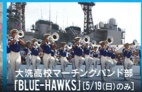
大洗高校マーチングバンド部 「BLUE-HAWKS」 [5/19(日)のみ]