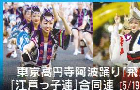
東京高円寺阿波踊り「飛鳥連」 「江戸つ子連」合同連 [5/19(日)のみ]